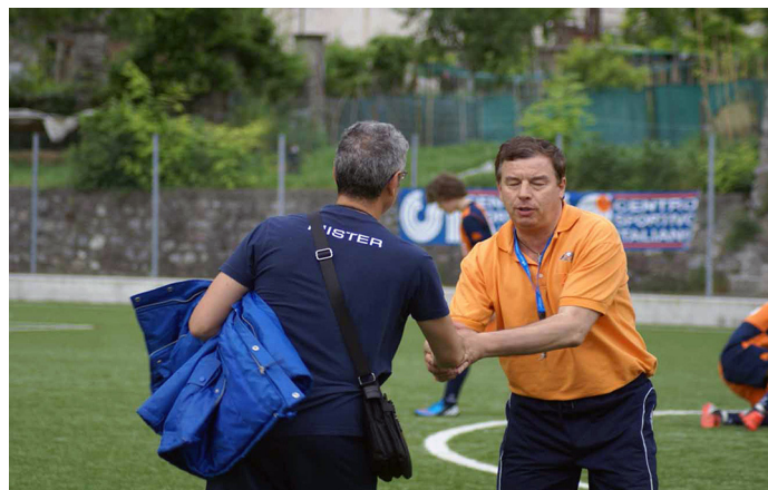
Il Comitato lancia la campagna per avere un allenatore per tutte le squadre

pensa che i corsi inizieranno a partire da novembre.