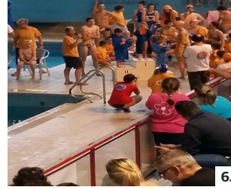
La domenica del nuoto. 1. Gli atleti schierati. 2. Le gare. 3. La cerimonia protocollare. 4. Nuotatori in vasca. 5. Il grande selfie della "Happy Sport Team". 6. La premiazione degli atleti più piccoli, i campioni del futuro