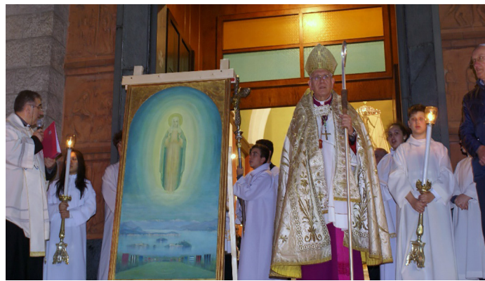
Solenne arrivo della "Madonna dei calciatori" a Laveno Mombello in chiesa