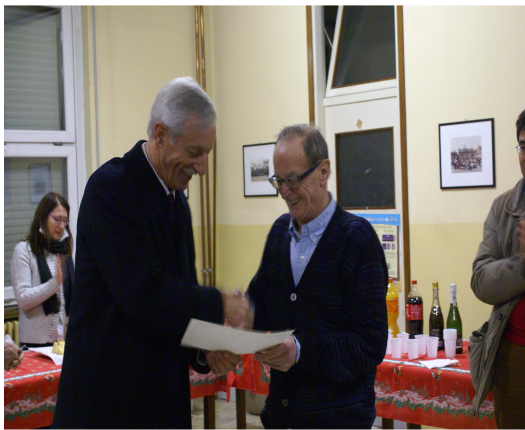
Il Csi San Luigi Tradate è la società discobolo d'oro per la fedeltà associativa

Certamente, in assemblea è stata discussa la proposta della società Hellas Cunardo sulla realtà della formazione obbligatoria dei presidenti di società. Anche altre proposte della società, su allargamento dei gironi e cartellino azzurro sono state al centro del dibattito e saranno oggetto anche di ulteriori valutazioni del Consiglio che ascolta tutte le società del territorio di cui, non dimentichiamolo, è la massima espressione, ma che non può essere avulso dalla base e dalle sue istanze. ■