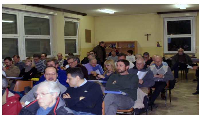
Alle società sportive serve essere aggiornate anche sul fisco

Il primo corso ha perseguito l'obiettivo di informare i partecipanti su come si svolge una verifica fiscale dell'Agenzia delle Entrate per le associazioni sportive